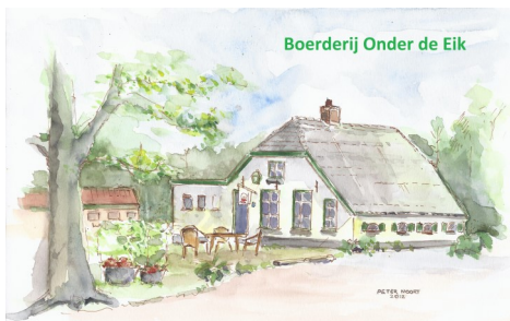
Natuurlijk, een hapje eten

Begin december zullen we naar de camping verhuizen en in Hellendoorn aan de slag gaan met diverse verdere voorbereidingen.